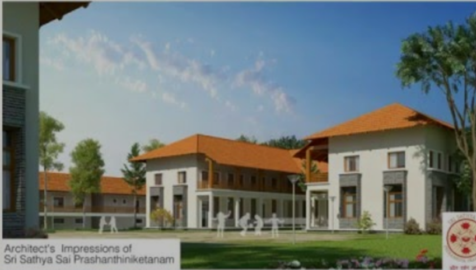
Architect's Impressions of Sri Sathya Sai Prashanthiniketanam