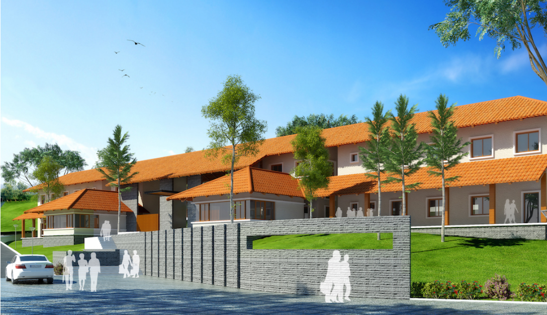
Imagen artistica del Sri Sathya Sai Prashanthiniketanam

En la Divina Presencia de Bhagawan Sri Sathya Sai Baba, Bhoomi Puja para el nuevo campus Pre Universidad de Mujeres, ' Sri Sathya Sai Prashanthiniketanam ' (cerca de Sathya Sai Grama, Muddenahalli) en Chikkaballapur, se llevara a cabo a las 9am el viernes 06 de Mayo de 2016, con la ocasión del Día de Easwarmma. ¡Todos estan invitados!