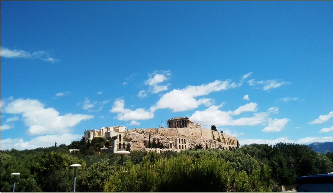
El Partenón en Acrópolis