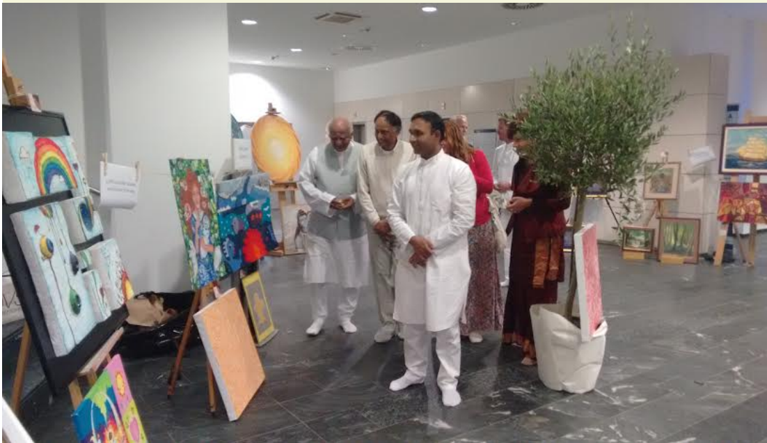
Recorrido de la exhibición: Bhagawan bendiciendo el arte hecho por los devotos