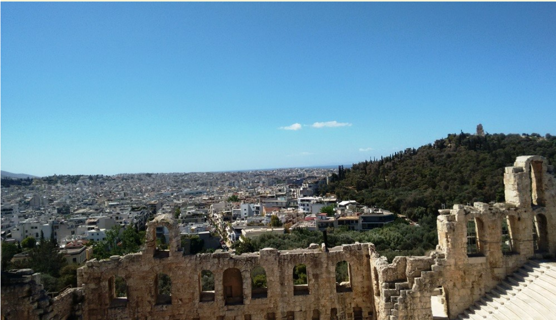
Una vista de Atenas desde el Partenón