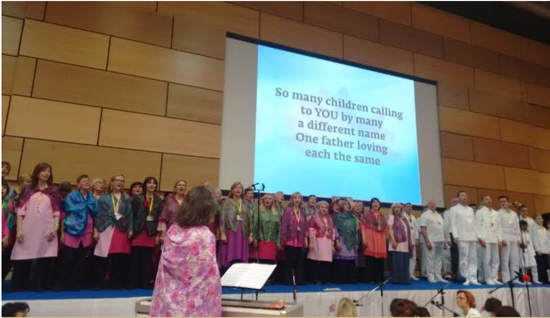
Emotiva presentación por jóvenes y viejos a los Pies de Loto de Bhagawan