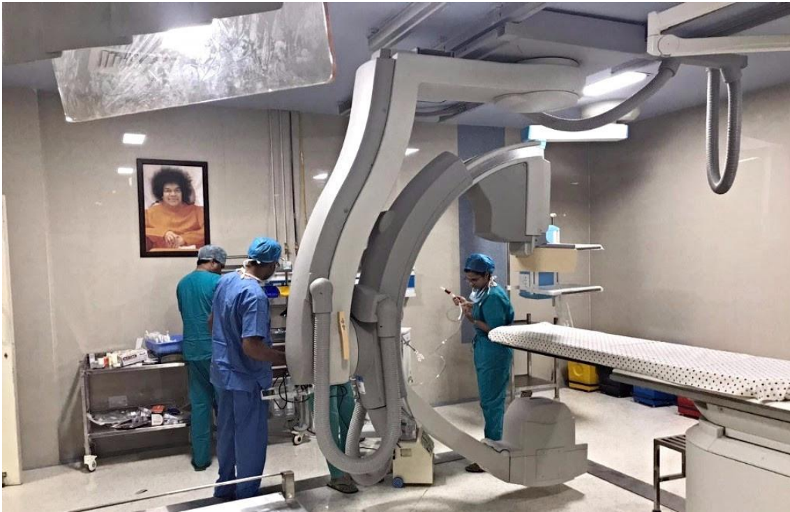
Primer Laboratorio de Cateterismo gratuito en la India, inaugurado en el Centro Internacional de Cardiología Pediátrica e Investigación, en la aldea de Baghola, distrito de Palwal, estado de Haryana, el 20 de junio de 2017.