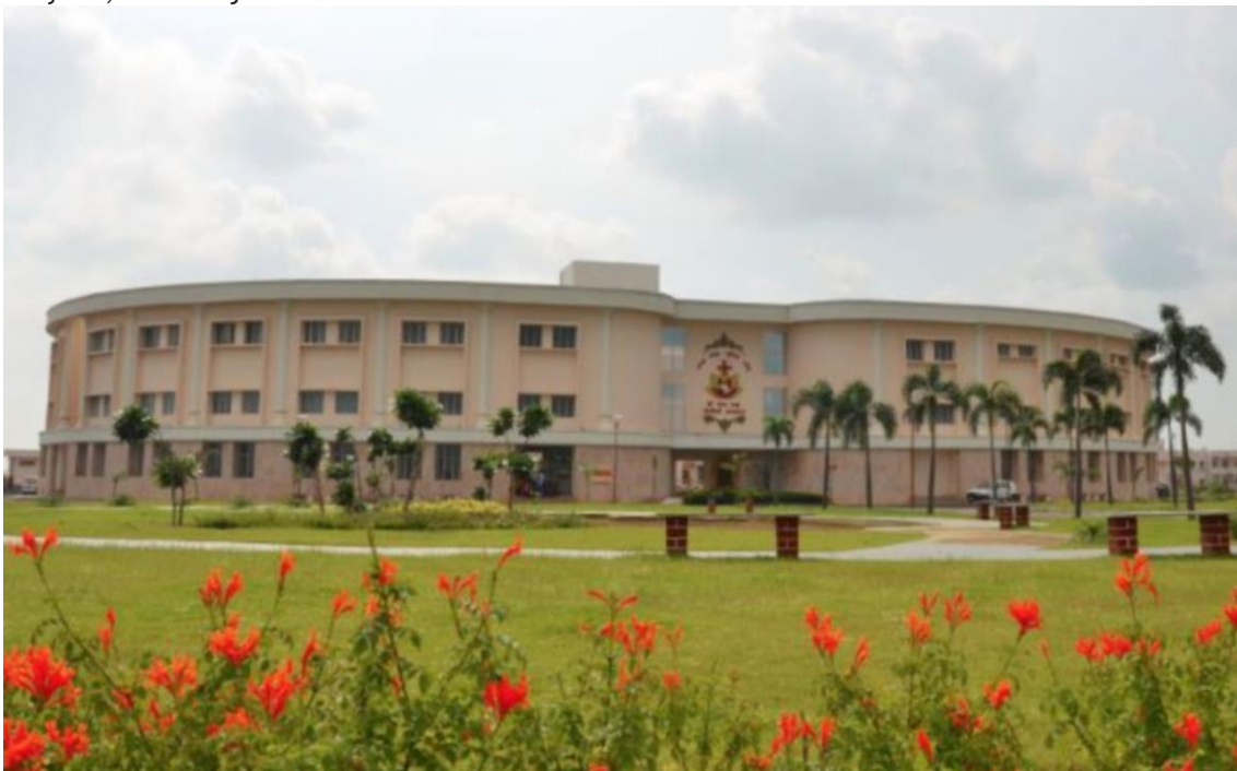
Hospital «Sathya Sai Sanjeevani» de Cardiología Infantil en Baghola, estado de Haryana.