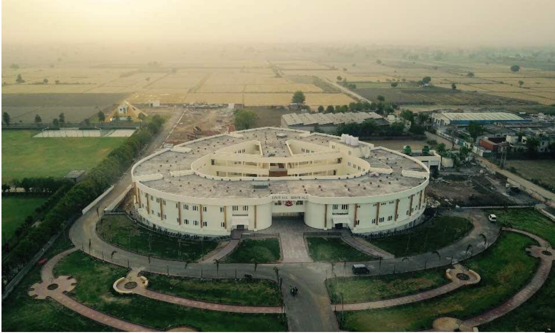
Hospital «Sathya Sai Sanjeevani» de Cardiología Infantil en Naya Raipur («Nueva Raipur»), estado de Chhattisgarh.