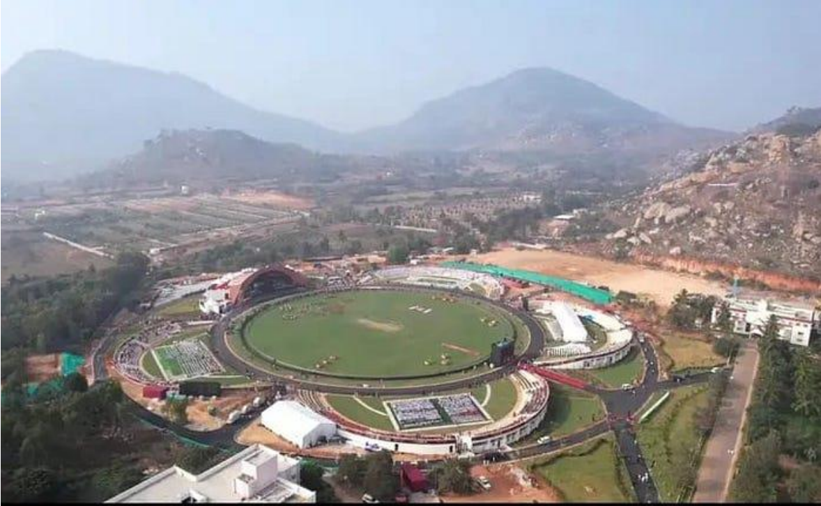
Estadio Sai Krishnan, en Sathya Sai Grama – Vista panorámica

El partido de críquet T-20 de la "Copa Un Mundo, Una Familia" entre el Once "Un Mundo" de Sachin Tendulkar y el Once "Una Familia" de Yuvaraj Singh fue un partido de leyendas, ¡pero con una diferencia! No se trataba de una recaudación de fondos, no se vendieron entradas, sino que se puso a la "venta" —GRATIS para todos— la increíble alegría de ver críquet de primera categoría el jueves 18 de enero de 2024 en la pequeña aldea de Sathya Sai Grama, en la India rural, a unos 40 minutos del aeropuerto internacional de Bangalore.