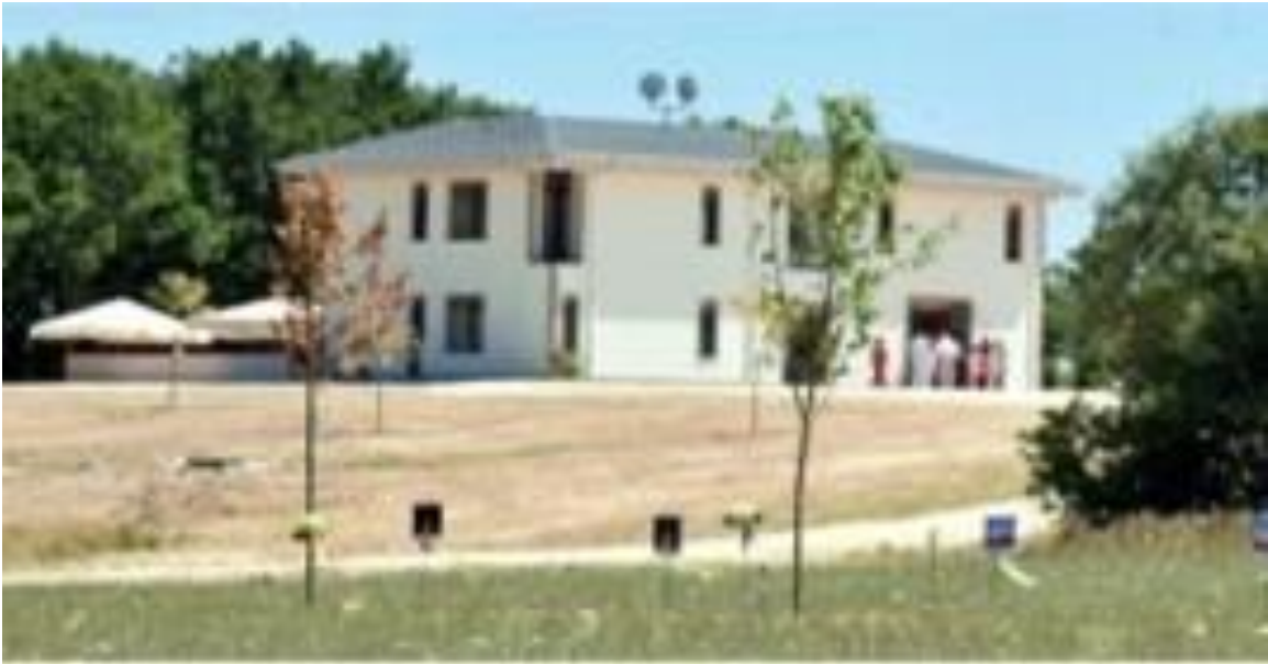
Prema Yoga Ashram